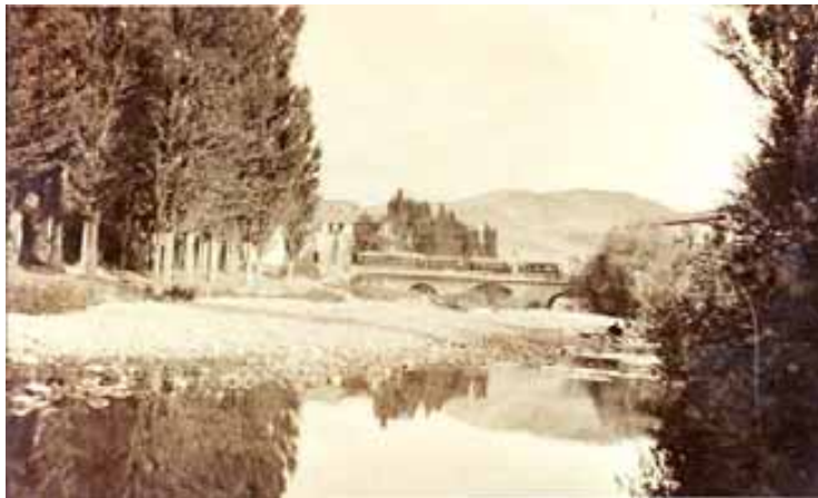
037.- Huarte.