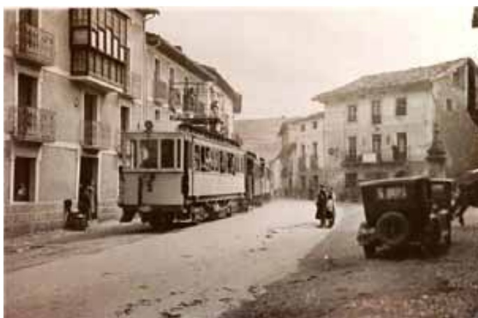
050.- Huarte. El automotor nº 2 arrastra coches de viajeros, a su paso por delante de Casa Navarro.