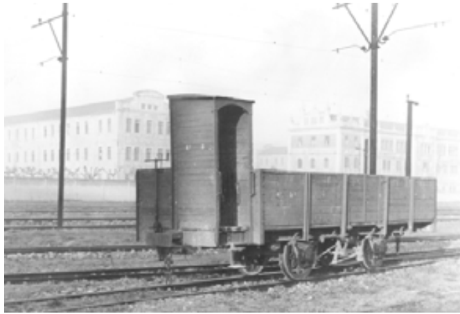
026.- Pamplona. Vagón de bordes altos UF con garita de guardafreno.