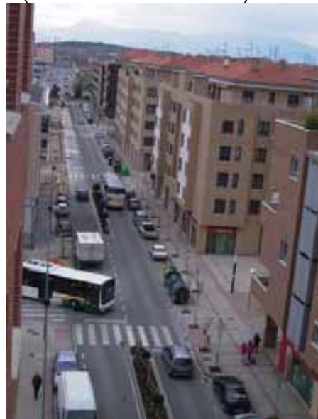
032.- Ansoain. Año 2006. Imagen actual de la calle Hermanos Noain, construida sobre el antiguo trazado de la vía.