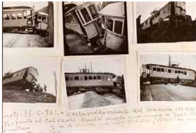
053.- Huarte. 13 de junio de 1942. Descarrilamiento de "El Irati" junto al Calvario, con el resultado de una mujer muerta.