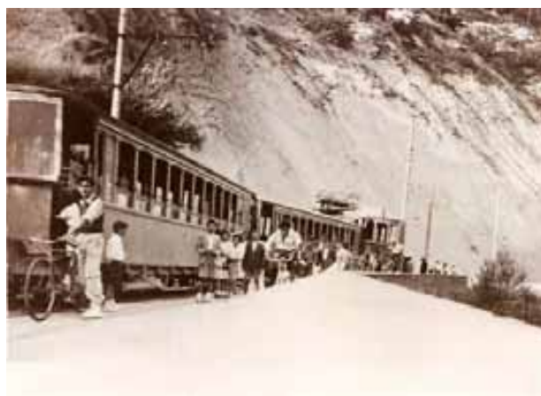
054.- Huarte..