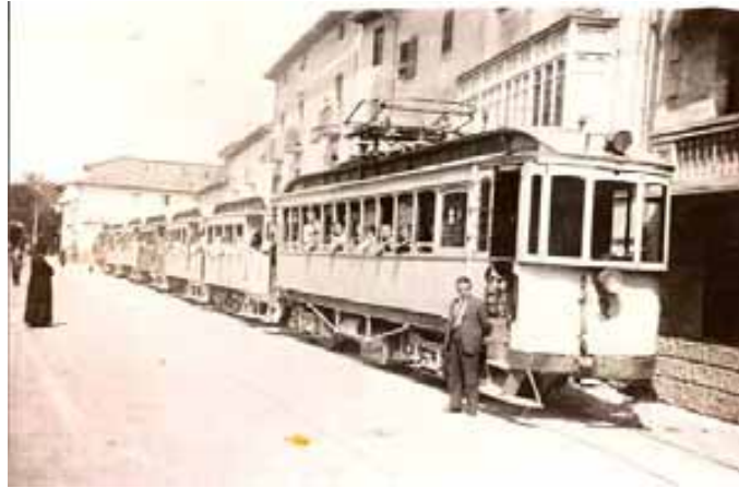
043.- Huarte. Automotor nº 2 arrastrando 6 coches de viajeros.