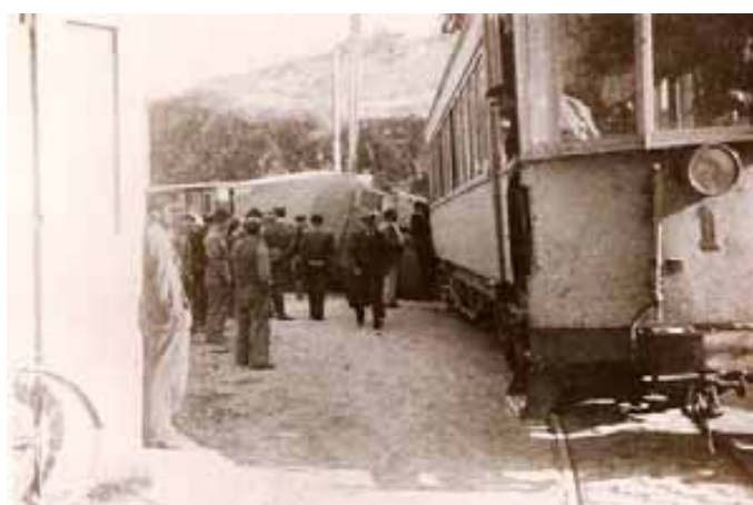
042.- Huarte. Accidente. En primer plano el automotor nº 1.