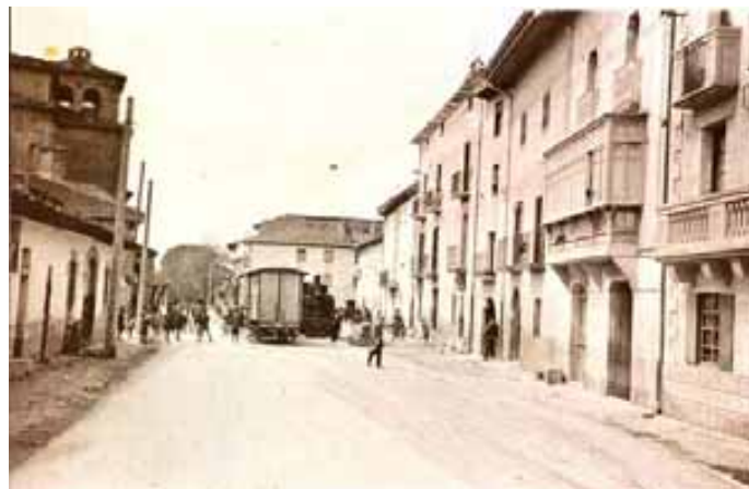
045.- Huarte. (Archivo Butini).