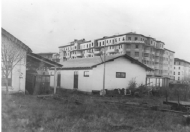
029.- Pamplona. Terrenos de “El Irati” anexos a sus cocheras de la Avda. General Franco (actual Avda. Baja Navarra), donde hoy está el ambulatorio Solchaga. En la imagen puede verse al automotor nº 11 a la espera de ser reparado.