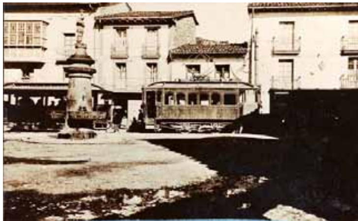
038.- Huarte.