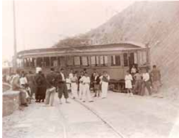
055.- Huarte. Accidente.