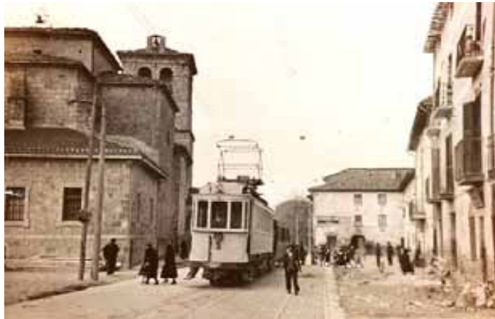
044.- Huarte. Ascenso y descenso de viajeros. Automotor nº 3.