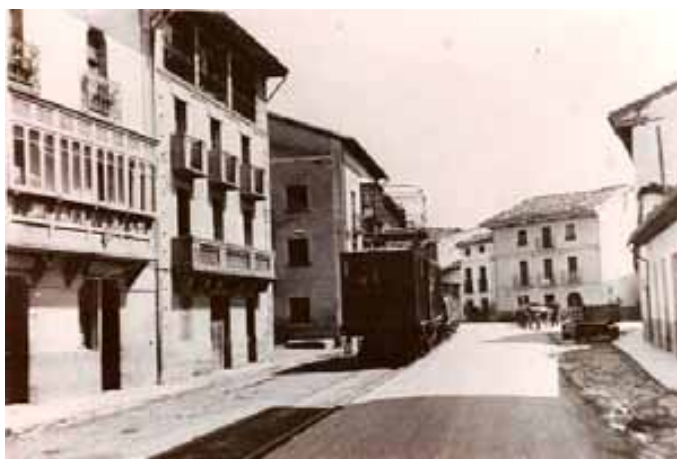
041.- Huarte.