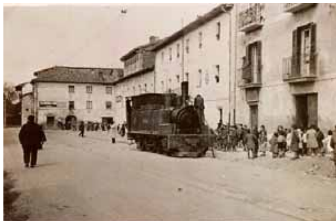
048.- Huarte. Locomotora "Vascongada" contemplada por los niños de la escuela. (Archivo Butini).