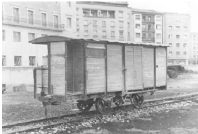
027.- Pamplona. Furgón cerrado de la serie R en la estación de Conde Oliveto.