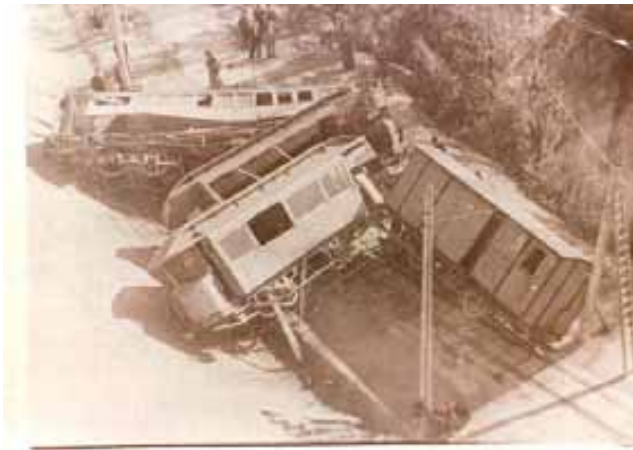
056.- Huarte. Accidente..