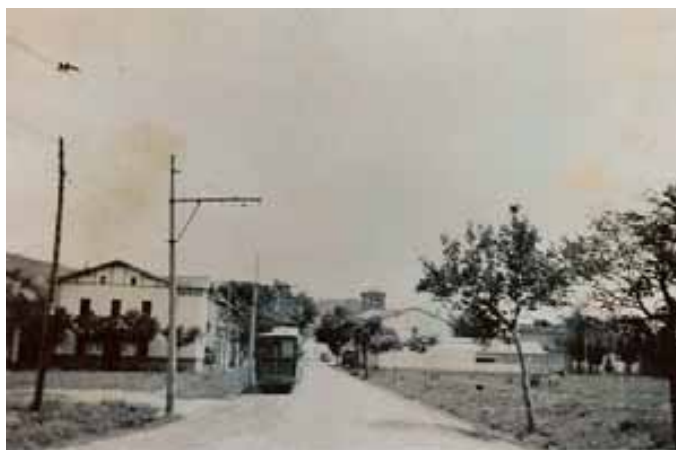
049.- Huarte.