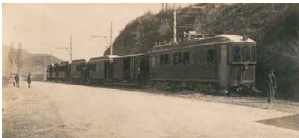
057.- Huarte.