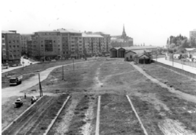
030.- Pamplona. Terrenos de la estación de Conde Oliveto con las casas de la Avda. Zaragoza al fondo.