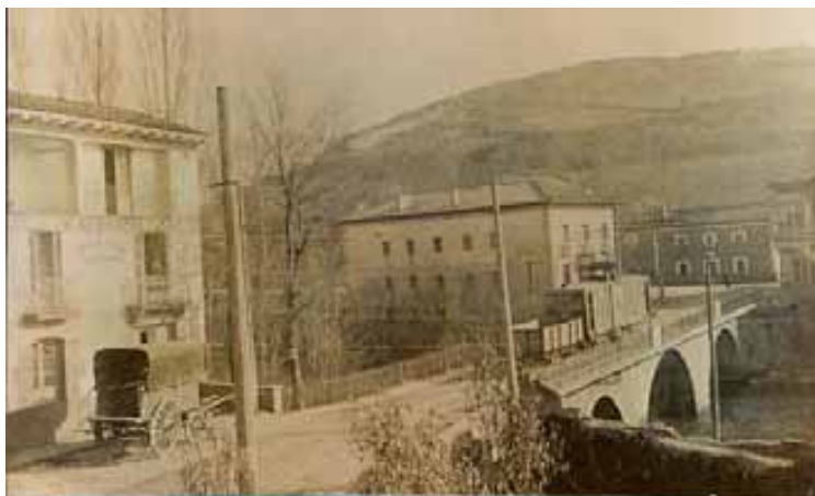
039.- Huarte.