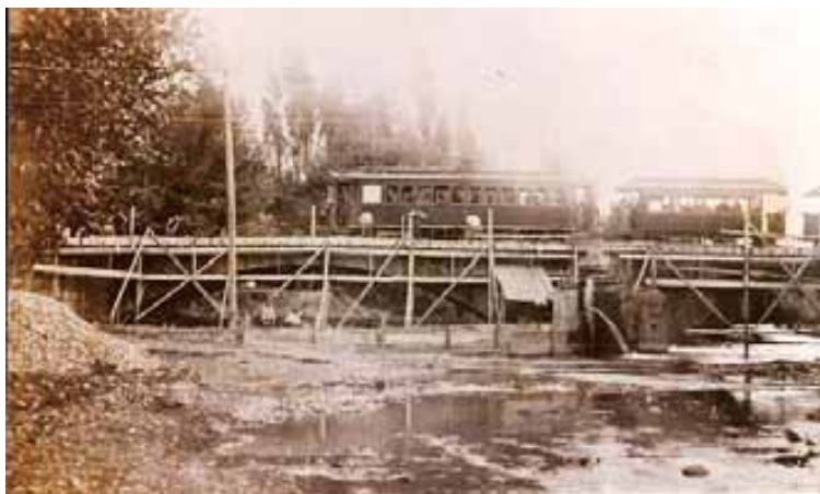
040.- Huarte.