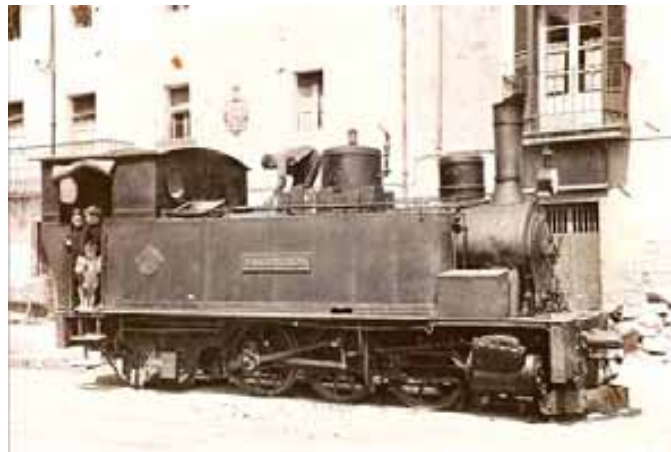
047.- Huarte. Locomotora "Vascongada".