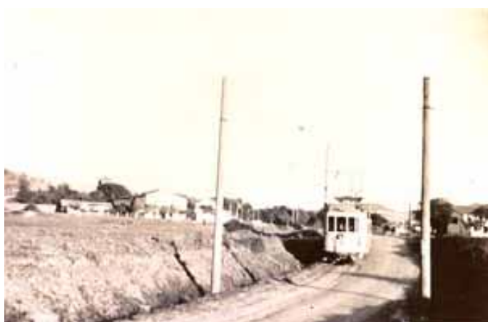
051.- Huarte.