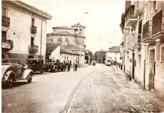
052.- Huarte. (Archivo Butini).