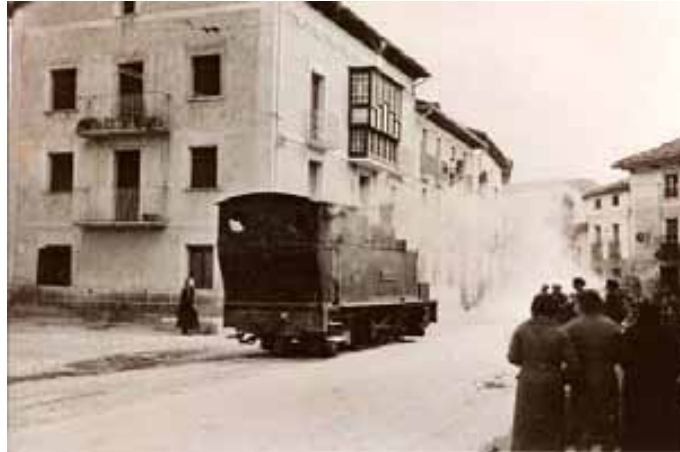
046.- Huarte. Locomotora "Vascongada". (Archivo Butini).