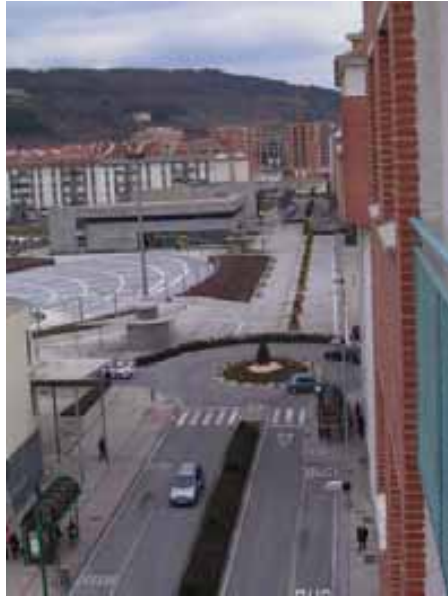
031.- Ansoain. Año 2006. Imagen actual de la calle Hermanos Noain, construida sobre el antiguo trazado de la vía.